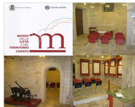
Logo e foto delle sale del Museo della Città e del Territorio di Corato (Via Trilussa - ex carcere) dove si terrà la presentazione dei piani e degli obiettivi del Gal per il 2012

▶ per informazioni sull'evento, scrivi a animazione@galcdm.it o chiama lo 0883 290243